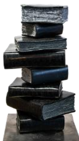
Obraz 3a. biblioteka.png przed transformacją; rozmiar 150 px na 235 px