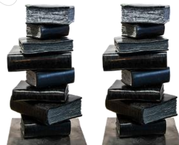
Obraz 3b. biblioteka.png po transformacji; rozmiar 300 px na 235 px