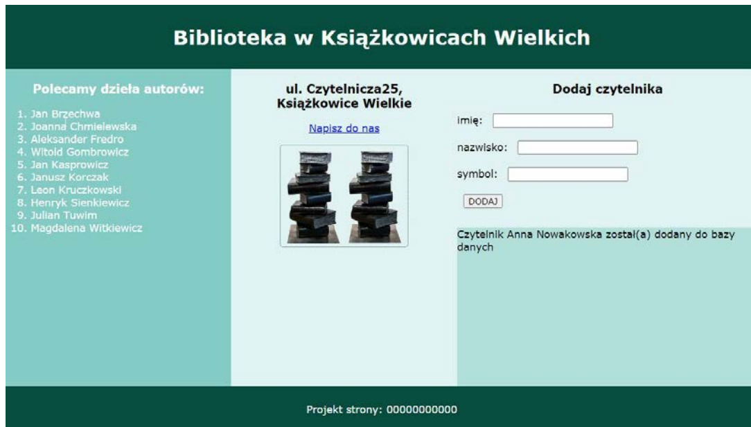
Obraz 2. Witryna internetowa. Po zatwierdzeniu danych z formularza